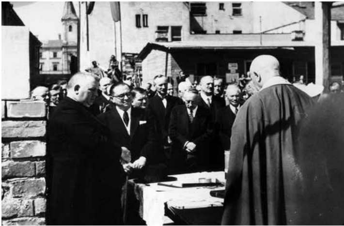
Kladenie základného kameňa budovy 7. júla 1942 za účasti prezidenta republiky katolíckeho kňaza Jozefa Tisa